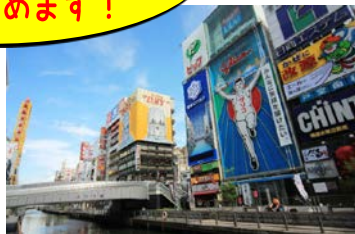
大阪・道頓堀（イメージ）