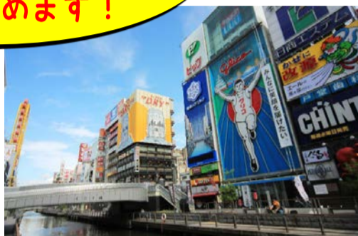
大阪・道頓堀（イメージ）