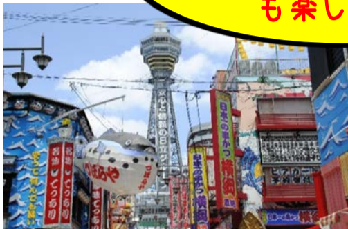
大阪・新世界（イメージ）