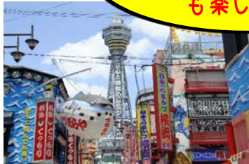
大阪・新世界（イメージ）