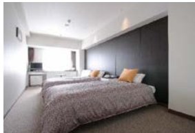
ホテル一例 プラザオーサカ（客室）